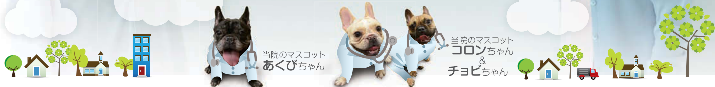
当院のマスコット あくびちゃん